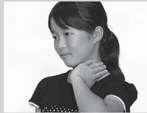
脈はくを首で調べる。