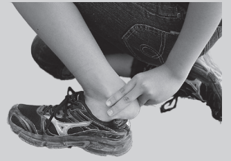
脈はくを足で調べる。